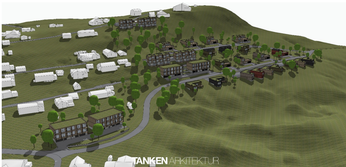
Figur 2: En av illustrasjonene til Tanken Arkitekter. På bakgrunn av dette studiet er det gjort noen endringer i reguleringsbestemmelsene.